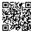
Catálogo Nacional (CNCP)