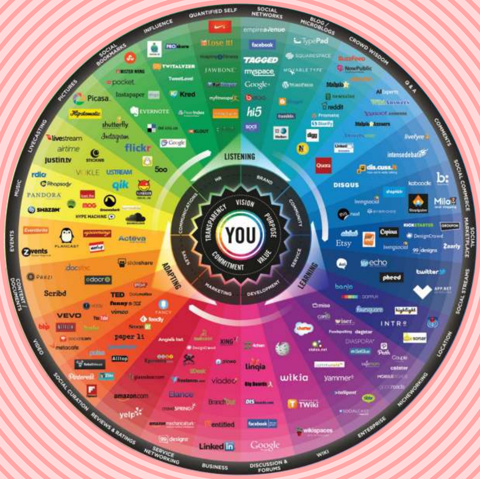
Mapa visual do panorama das redes sociais segundo o seu dominio ou potencialidade, organizadas por como son usadas a diario